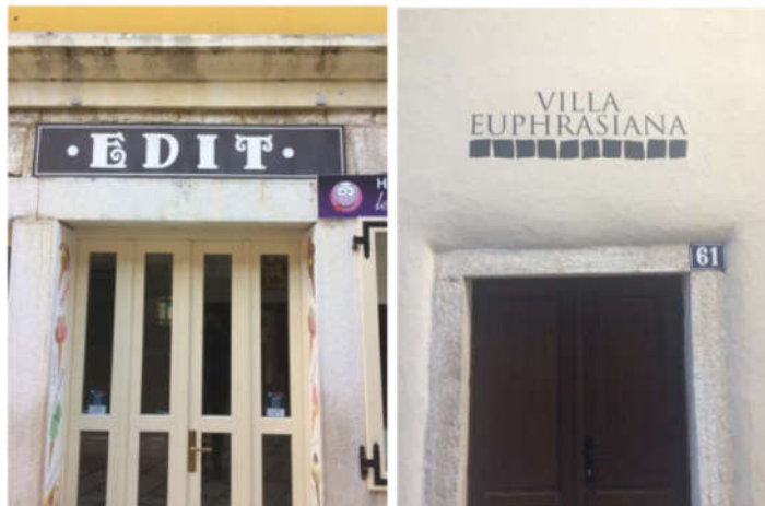
Dobri primjeri natpisa iznad ulaza za drugu zonu (Edit se nalazi u prvoj zoni)