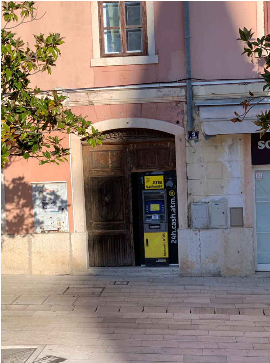
Totalno neprimjereno postavljanje bankomata u povijesnoj jezgri grada

Postavljanje bankomata unutar starogradskih jezgri rješava se sukladno “Općim kriterijima za ugradnju bankomata u zaštićenim povijesnim jezgrama” kojeg je Ministarstvo kulture RH uputilo Udruzi gradova u Republici Hrvatskoj 18. lipnja 2019. godine. – link za preuzimanje: https://www.udrugogradova.hr/wordpress/wp-content/uploads/2019/06/MinKult-ugradnja-bankomata.pdf