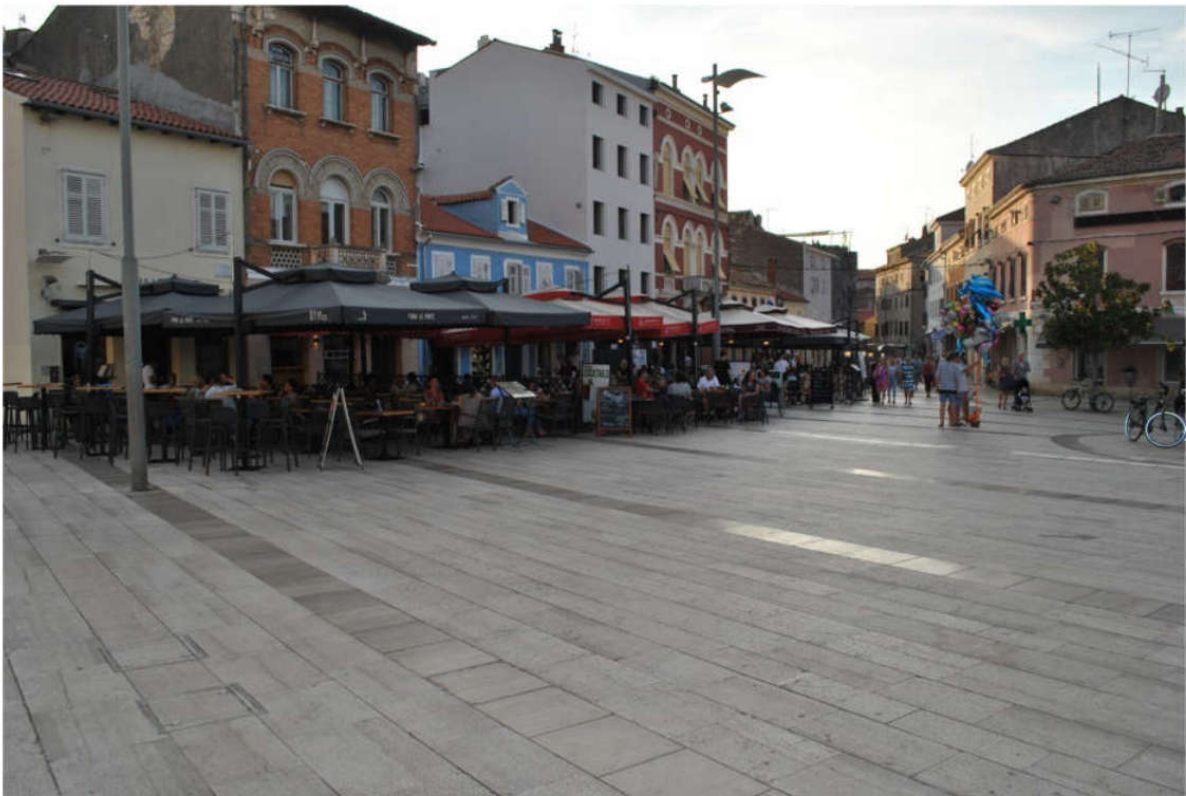
Dobar primjer ujednačenih suncobrana

Jastuci u boji tende (bordo RAL 3004, prljavo bijela RAL 1013 ili antracit RAL 7016).