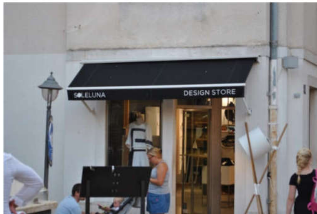
Dobar primjer natpisa na mantovani za drugu zonu (nalazi se u prvoj zoni)

Natpis iznad ulaza u objekt može imati pozadinsku rasvjetu, u pravilu LED postavljenu sa stražnje strane natpisa. Rasvjeta natpisa ne smije biti na zidu postavljena kao zasebni element. Boja rasvjete prema toplom, svijetlo žutom tonu. Svijetlo mora biti konstantno, ne smije žmirkati, treperiti, bljeskati ili mijenjati boje.