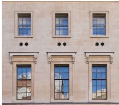
Donekle prihvatljivo postavljanje