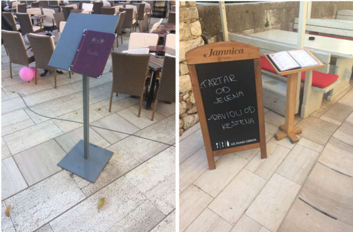
Dobri primjeri stalka: A-stalak i stalak za meni

Fotografije jela mogu se nalaziti isključivo u meniju maksimalnih dimenzija 42x29,7 cm (A3 format).